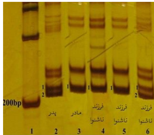
تصویر شماره ۱: نشانگر D11S1893

در این نشانگر آللی افراد در تعیین ژنوتایپ و احتمال پیوستگی همخوانی ندارد. پدر و مادر شنوا هستند.