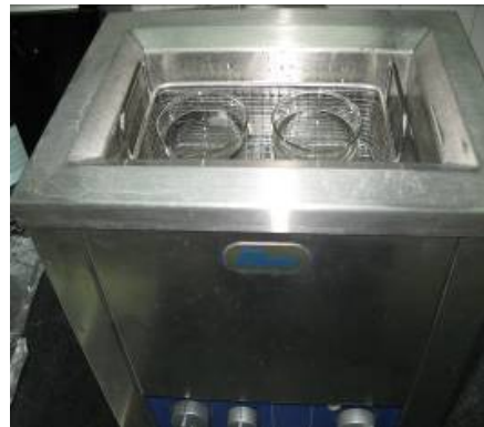
تصویر شماره ۲: تصویر راکتور التراسونیک (Batch)